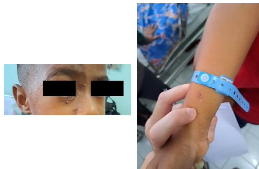
Gambar 1. Lokasi gigitan pada pasien

vulnus morsum area infraorbital dextra dan antebrachial dextra, perdarahan aktif (-).